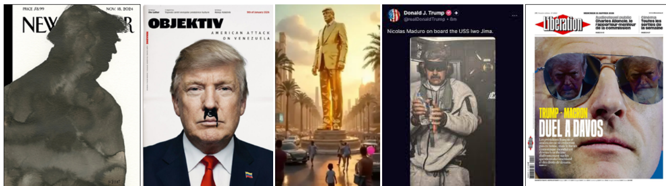
Imagen 1. La sombra de un porvenir postdemocrático

“[...] No basta con «mostrar lo que está oculto»” señala el cineasta Sylvain George en el Diálogo de este número de l’Atalante . “Tal concepción sigue suponiendo que el cine es un espejo de la realidad, un simple dispositivo de revelación o restitución. [...] Es importante, entonces, desplazar las coordenadas de este enfoque. Porque lo que está en juego hoy, no es solo la ausencia de representación de ciertas existencias, sino su producción misma como representaciones mutiladas. El acto de filmar, por consiguiente, no puede contentarse con una función reparadora o ilustrativa. Supone una desarticulación activa de los regímenes de visibilidad dominantes.”