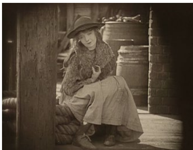
Imágenes de la 1 a la 4. Lirios rotos (D. W. Griffith, 1919)

también en algunos de los planos que encuadran a Battling Burrows, pero nunca para el personaje de Lucy. En Lirios rotos la imagen está organizada meticulosamente y muestra un dominio total de la capacidad expresiva de las formas geométricas. La presentación visual de Lucy, que camina por los muelles de Limehouse antes de entrar en casa, denota su insignificancia y la indiferencia hacia ella del mundo que la rodea gracias a la oposición entre formas rectas y circulares. Lucy aparece encorvada en un paisaje marcado por postes de madera y la figura hierática de un marinero, cuya verticalidad contrasta con la ausencia de fortaleza de ella (Imagen 3). Posteriormente, Lucy se sienta