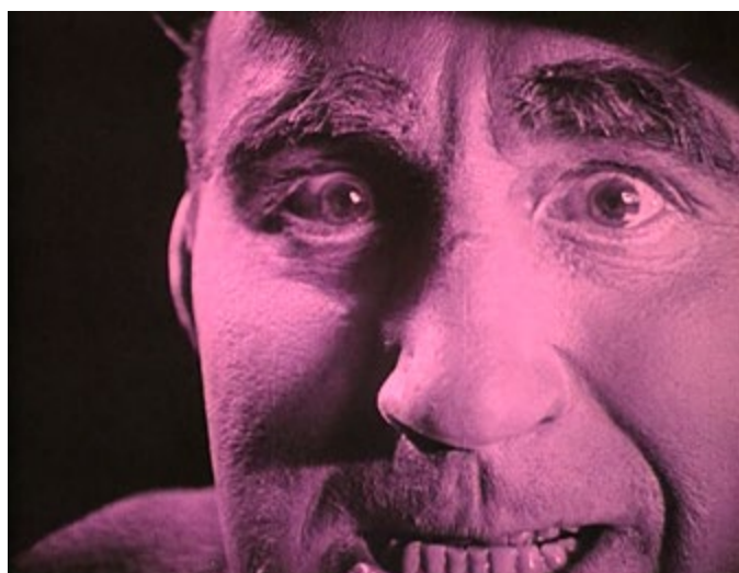
Imágenes de la 19 a la 22. Lirios rotos (D. W. Griffith, 1919)

entre ambos personajes (Imagen 20). Por montaje, el plano subjetivo se ancla en la mirada de Lucy, subrayada por una máscara (Imagen 21). De nuevo en el plano subjetivo de Lucy, Burrows se acerca a la cámara, mientras sus ojos están clavados en el objetivo (Imagen 22). El avance de Griffith es notable: no se trata solo de articular un plano subjetivo, sino de subrayar la subjetividad de la imagen más allá de la capacidad de la cámara para posicionarse en los ojos de un personaje. Se trata, en suma, de una imagen mental que deforma la realidad física que ese personaje percibe. Algo que queda patente por dos motivos: el fondo se sustrae por completo en el primer plano de Burrows, y su