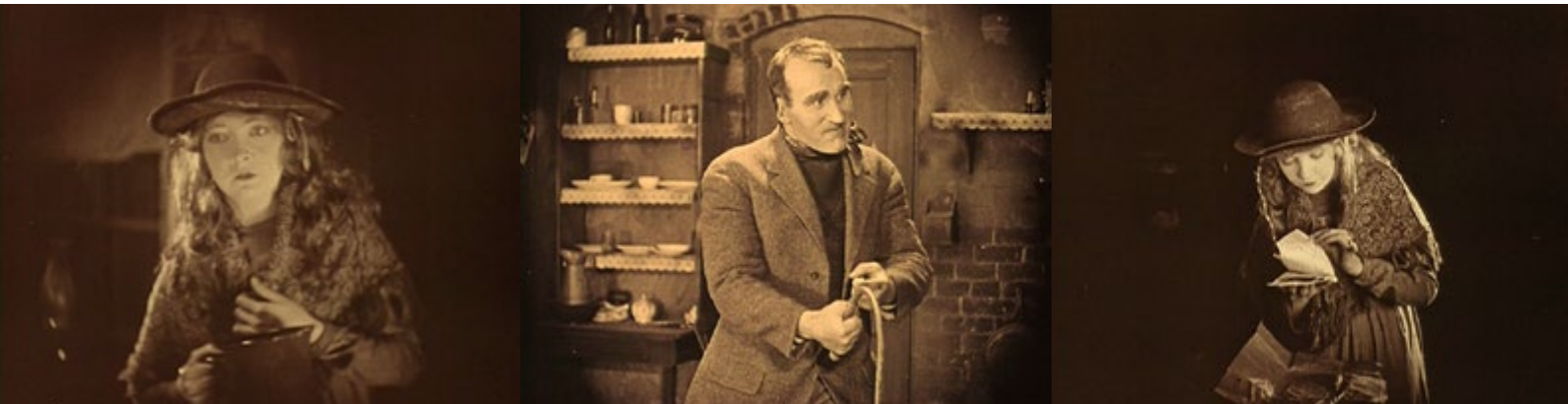
Imágenes de la 16 a la 18. Lirios rotos (D. W. Griffith, 1919)

viene abordar como errores, sino como opciones expresivas sistematizadas en el texto.