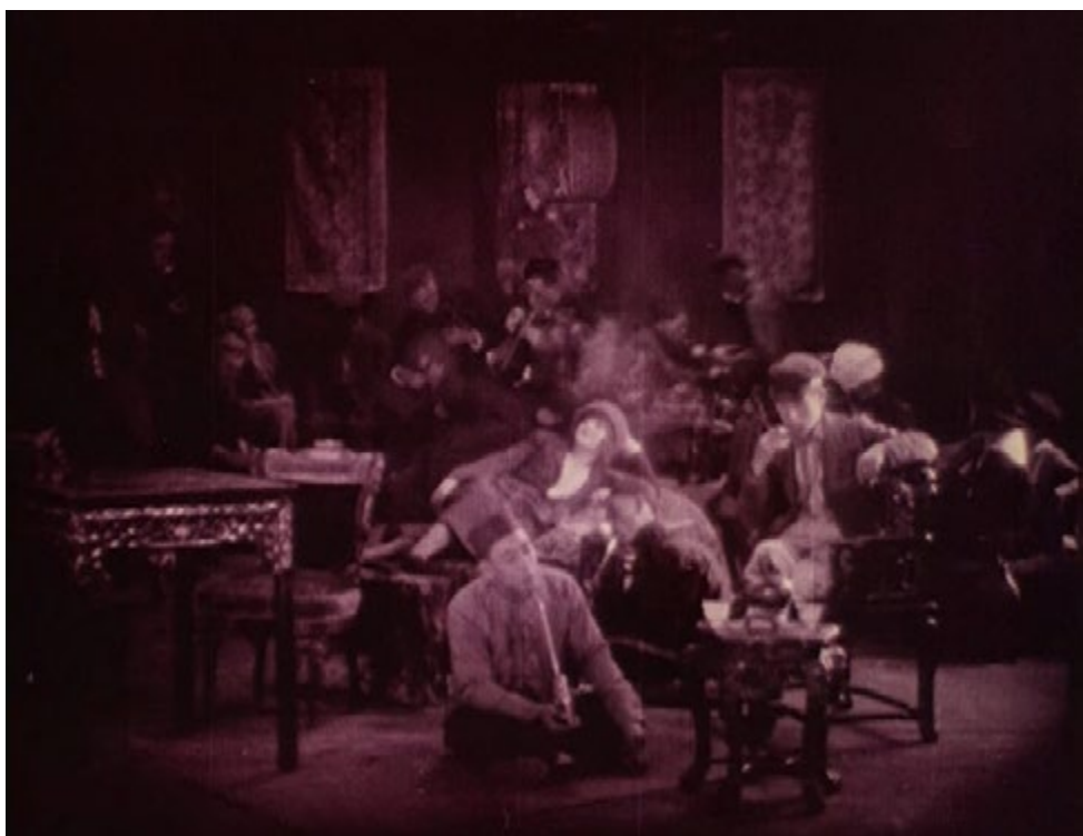
Imagen 7. Lirios rotos (D. W. Griffith, 1919)

Comprender las siguientes operaciones de descentramiento requiere detenerse en la configuración espacial de la casa de Lucy (Imagen 8). En un rasgo claramente primitivo, Griffith sigue trabajando con una concepción espacial deudora del teatro. La configuración del espacio que presenta Lirios rotos no es ajena al resto de su obra: la cámara se posiciona de manera frontal al decorado, a la altura de los ojos, de modo que ocupa una posición exterior similar a la que ocuparía un espectador teatral en la platea. Asimismo, los límites laterales del encuadre coinciden con los límites físicos del decorado, reforzando la equivalencia entre el espacio profílmico y la caja teatral. En el caso que nos ocupa, la puerta de entrada a la casa se sitúa en el margen derecho, mientras que en el izquierdo hay otra puerta, que da acceso a la alacena que jugará un papel fundamental en el clímax. La ilu-