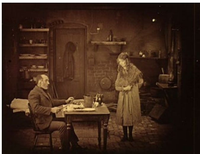
Imágenes de la 8 a la 11. Lirios rotos (D. W. Griffith, 1919)

padre amenaza a la chica. El espacio de la casa, lejos de ser neutro, se impone sobre el personaje femenino y define las posiciones que puede ocupar en el mismo. Así, en la primera escena que tiene lugar en la casa, Burrows designa explícitamente mediante un gesto el lugar que le corresponde a Lucy en los fogones (Imagen 9). El primer término